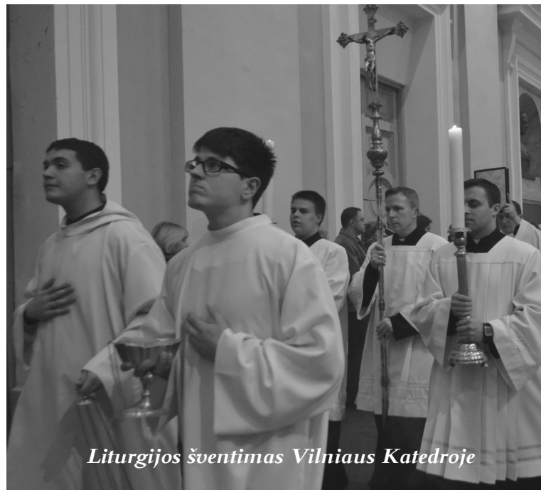
Liturgijos šventimas Vilniaus Katedroje

Taigi jau į pabaiga. Perskaičiau viską, ką parašiau, ir tikrai... baisiai jaunas esu. Visom prasmėm. Po metų ar kelių skaitydamas šį straipsnį galvosiu, kaip keistai mažiau, gal vaikiškai, gal per emocionaliai, nebrandžiai ar dar kaip nors... bet viena aišku, kad per šį laiką seminarijoje dar daug kas keisis manyje ir mano gyvenime. Ir ačiū Dievui, nes permainos reiškia, kad nestoviu vietoje. Meldžiuosi, kad judėčiau tik į priekį. Prašau melskitės ir jūs.