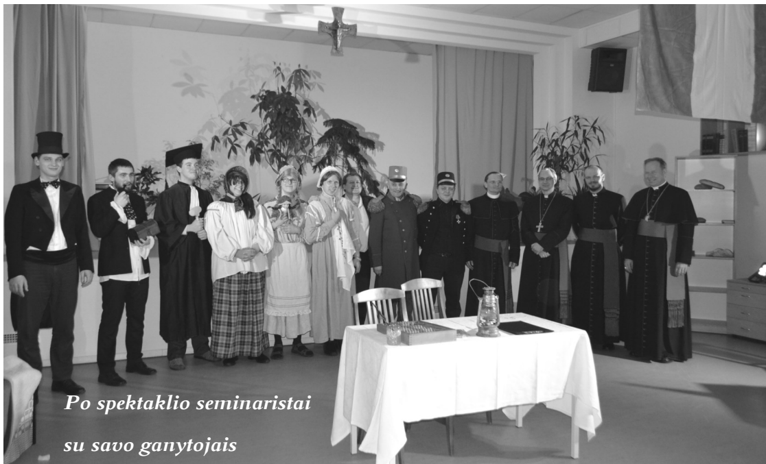
Po spektaklio seminaristai su savo ganytojais

Ir aš ten buvau, alų, midų gėriau ir su šv. Juozapu nuostabų klierikų spektaklį apie vargdienius žiūrėjau.