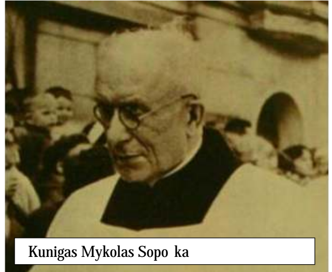
Kunigas Mykolas Sopočka

kuriuo sesuo Faustina susitiko 1933 m. gegužės mėnesį Vilniuje, o dar anksčiau pažino jį per dvasinį regėjimą, kai išvydusi kunigą Mykolą tarp altoriaus ir klausyklos išgirdo tokius Jėzaus žodžius: Štai tau