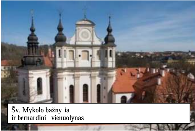
Šv. Mykolo bažnyčia ir bernardinai vienuolynas