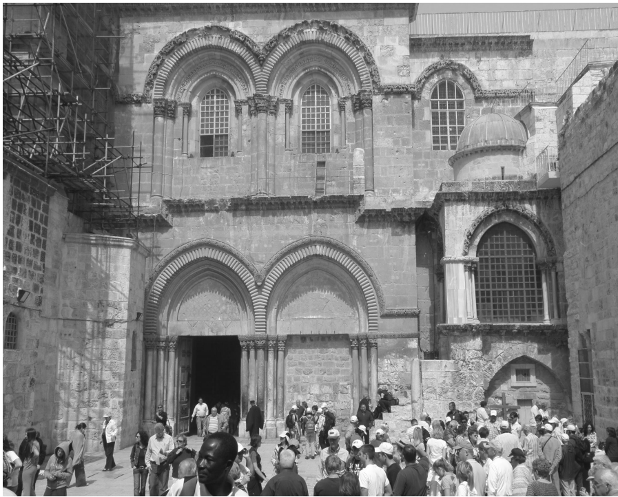
Šventojo Kapo bažnyčia Jeruzalėje

Po Romos imperijos žlugimo krikščioniška Bizantija valdė Jeruzalę. 614 m. padedant žydams miestą užėmė persai. Persų armija tūkstančius krikščionių gyventojų išžudė, o didesnę dalį ištrėmė. Po 10 metų Bizantija atkovojo Jeruzalę, o žydai pažadėjo paklusti Bizantijos imperatoriui Heraklėjui, tačiau šis baimindamasis izraelitų sukilimo išvarė žydus iš Jeruzalės. Vėliau imperatorius įsakė išžudyti tuos izraelitus, kurie atsisakė pasikrikštyti. Koptų vienuoliai iki šių dienų turi atpirkimo pasninką, kuri atlieka už atgailą dėl Heraklėjo elgesio su žydais.