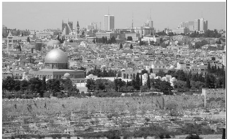
Uolos katedra ir Jeruzalės miesto siena

Seleukidų karalius Antiochas IV Epifanas (pasivadinęs Apsireiškusiuoju Dievu) nusprendė sunaikinti žydų religiją.