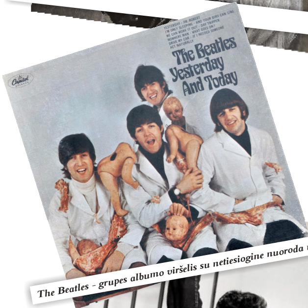
The Beatles - grupės albumo viršelis su netiesiogine nuoroda už abortus