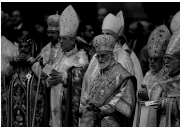
Fot. Rytų katalikų Bažnyčių patriarchai ir vadovai per 2010 m. Romoje vykusį Vyskupų Sinodą Artimiesiems Rytams.

Pradėti šį straipsnį ketiname nuo išgalvoto, o gal ir tikro, nutikimo. Viename Šiaurės Amerikos graikų apeigų katalikų vienuolyne viena garbingo amžiaus lotynų apeigų katalikė, pamačiusi ant sienos kabantį Jono Pauliaus II portretą, nustebusi pasakė: „Jūsų popiežius atrodo lygiai taip, kaip ir mūsų“. Vienuoliams teko viešniai ilgai aiškinti, kad popiežiai ne