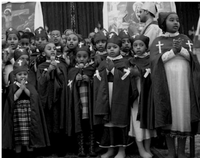
Fot. Etiopijos Rytų katalikų Bažnyčia. Vaikai Mišių metu.

Beveik visų Rytų Katalikų Bažnyčių kunigai (bet ne vyskupai) turi teisę sukurti šeimą. Kitame Teesie numeryje ketiname išsamiau aptarti Graikų apeigų katalikų Bažnyčias, kurios susijusios su Lietuvos istorija.