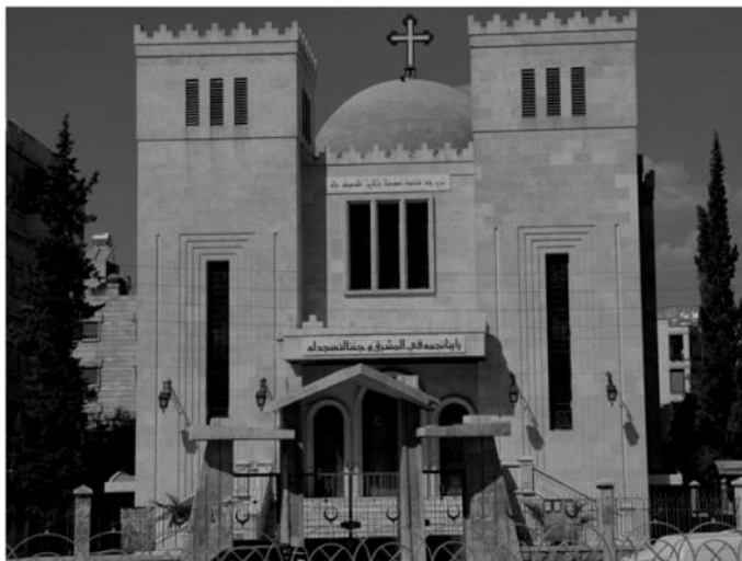
Fot. Chaldėjų katalikų bažnyčia Alepo mieste (Sirija).

Rytų Katalikų Bažnyčių liturgijos yra labai skirtingos ir priklauso penkioms skirtingoms pagrindinėms liturginėms grupėms: Aleksandrijos, Antiochijos, armėnų, chaldėjų ir bizantinei. Pastarajai liturginei tradicijai priklauso net 14-ka skirtingų įsikultūrinimo procese atsiradusių tautinių bizantinių apeigų atmainų (pvz.: baltarusų, ukrainiečių, slovakų, graikų ir kt.), pagal kurias meldžiasi 14-ka atitinkamų tautinių Bažnyčių (pvz., Baltarusijos graikų apeigų katalikų Bažnyčia, Ukrainos graikų apeigų katalikų Bažnyčia ir kt.). Todėl galima kalbėti apie skirtingus skirtingų Rytų Katalikų Bažnyčių dvasingumus ar liturgijas, o ne apie kažkokį vieną, bendrą visoms Rytų Katalikų Bažnyčioms dvasingumą ar liturgiją – posakis Rytų Katalikų Bažnyčios (ių) dvasingumas (ar liturgija) būtų tolygus posakiui Vakarų Europos kalba .