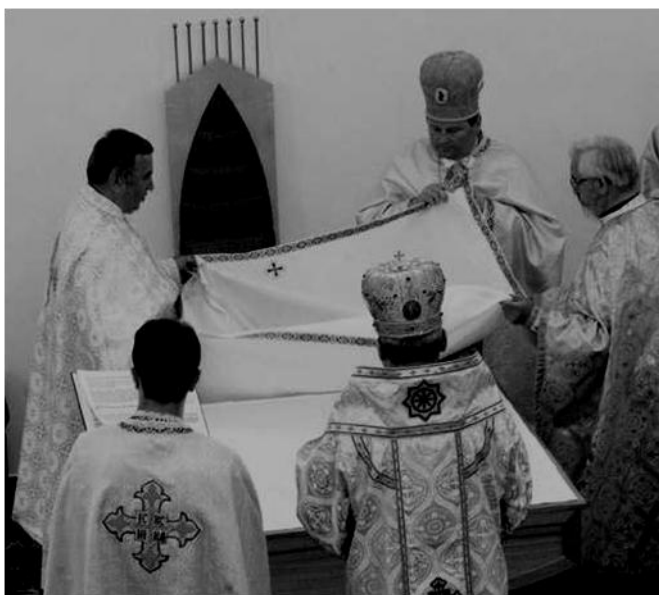
Fot. Slovakijos graikų apeigų katalikų Bažnyčia. Naujos bažnyčios konsekracija

Rytų Katalikų Bažnyčios turi skirtingus juridinius statusus: nuo daugiau savarankiškų patriarchiškų Bažnyčių (pvz. melkitų, maronitų, koptų ir kt.) iki mažiau autonominių – Didžiųjų Arkivyskupų (pvz. Ukrainos graikų apeigų katalikų Bažnyčia), metropolitų (pvz., Slovakijos graikų apeigų katalikų Bažnyčia) ar vyskupų (pvz., Kroatijos graikų apeigų katalikų Bažnyčia) vadovaujamų Bažnyčių. Bažnyčiai „subrendus“ galima siekti didesnio savarankiškumo laipsnio (pvz., 1992 m. Sirų malabarų Bažnyčia popiežiaus Jono Pauliaus II buvo pakelta iki Didžiosios Arkivyskupijos statuso, o Ukrainos graikų apeigų katalikų Bažnyčia jau nuo II Vatikano Susirinkimo viltingai