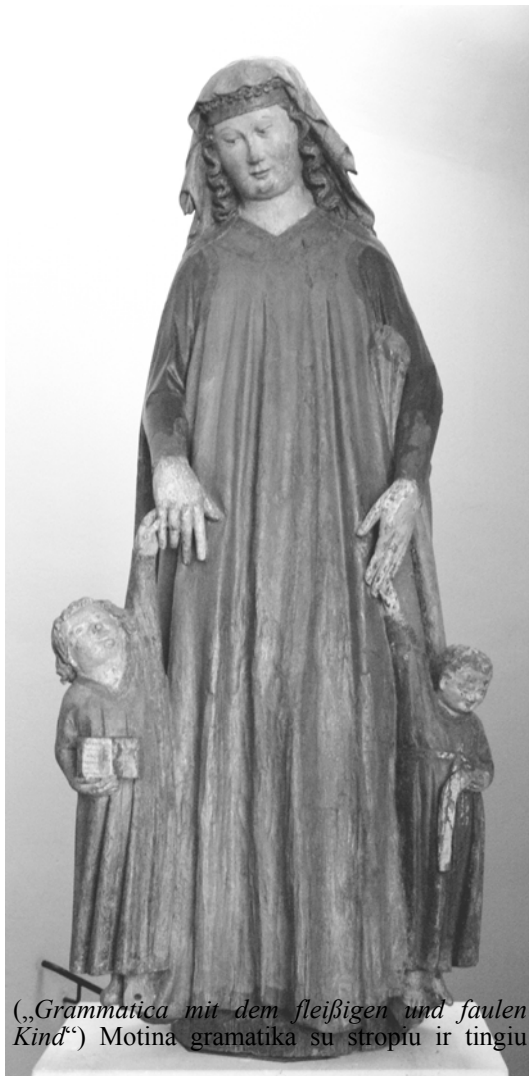
(„Grammatica mit dem fleißigen und faulen Kind“) Motina gramatika su stropiu ir tingiu

Dar reiktų priminti, kad dalelytė gi yra stiprinamoji (pvz.: Ir kam gi ši giminė reikalauja ženklų? ), su nekaitomais žodžiais rašoma kartu, su kaitomais – atskirai, tačiau nevartotina priešinio, gretinimo santykiams reikšti kaip jungtukų o , bet , tačiau sinonimas: Maloniai nustebino tai, kad susirinko daug studentų. Nuliūdino gi (=O nuliūdino) tai, kad jie diskutavo gana paviršutiniškai.