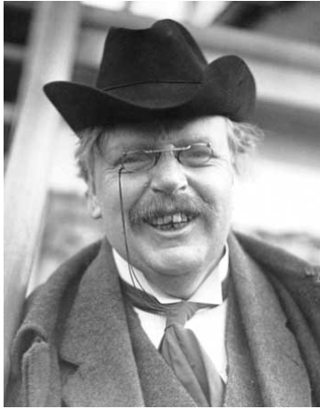
GILBERT KEITH CHESTERTON (1874 – 1936)

G.K. Chestertonas yra garsus anglų rašytojas, žurnalistas, krikščionybės apologetas, viena ryškiausių XX a. pradžios Europos kultūros figūrų. Jaunystėje studijavo dailę ir literatūrą, dirbo žurnalistu. 1922 m. priėmė katalikybę. Paliko beveik neaprepiamo dydžio literatūrinį palikimą, jau kelių kartų žmonėms esantį nesenkančiu įkvėpimo šaltiniu. Kaip rašytojas savo fantastiniuose alegoriniuose romanuose idealizavo viduramžius, patriotizmą, gerio ir blogio konfliktą laikė neišvengiamu ir pozityviu dalyku. Ypač populiarūs G.K. Chestertono detektyvinės novelės apie sekli kunigą Brauną, išverstos ir į lietuvių kalbą. Taip pat kūrė eilėraščius, balades, parašė teologinių esė, Pranciškaus Asyžiečio ir Tomo Akviniečio biografijas.