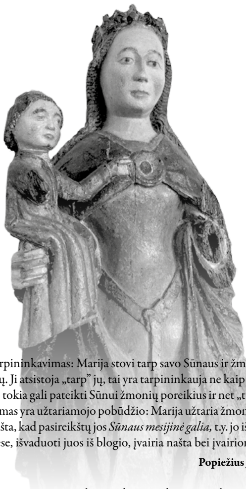
Dievo Motina (XIV a. pab. - XV a. pr. skulptūra, saugoma Vilniaus šv. Juozapo kunigų seminarijoje)

Tai – tarpininkavimas: Marija stovi tarp savo Sūnaus ir žmonių, kamuojamų skurdo, nepriteklių ir kančių. Ji atsistoja „tarp“ jų, tai yra tarpininkauja ne kaip pašalietė, bet kaip Motina , žinodama, jog kaip tokia gali pateikti Sūnui žmonių poreikius ir net „turi teisę“ tai daryti. Vadinas, jos tarpininkavimas yra užtariamojo pobūdžio: Marija užtaria žmones. Ir ne tik užtaria, kaip Motina ji taip pat trokšta, kad pasireikštų jos Sūnaus mesijinė galia , t.y. jo išganomoji jėga, skirta padėti žmonėms nelaimėse, išvaduoti juos iš blogio, įvairia našta bei įvairiomis formomis slegiančio jų gyvenimą.