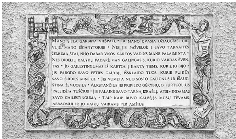
Lietuviškas Magnificat tekstas „Apsilankymo“ bažnyčioje Nazarete

protėviams. Ši istorijos išganymo giesmė pilna iškalbingų metaforų iš Senojo Testamento. Aplankymas, išpirkimas, ragas (jėgos, išgelbėjimo, pergalės simbolis), šviesa ir ramybė – visi šie žodžiai kreipia į Izraelio išlaisvinimą, nes tik pasireiškusių tautos istorijoje, bet ir dabartyje, taip pat nukreipti ir į eschatologinius laikus. Himnas prasideda ir baigiasi Aplankymo tema. Tai ypatingas žodis, nes aiškiai nurodo į Mesiją, kaip šviesą iš Aukštybių (Lk 1,78). Gr. k. žodis anatolē gali reikšti žvaigždę su labai aiškia nuoroda į Sk 24,17: „žvaigždė patekės iš Jokūbo, skeptras pakils iš Izraelio“ arba atžalą, apie kurią skelbia Zch 3,8: „Aš atsiųsiu savo tarną Atžalą“ ir kitoje vietoje: „Taip kalba Galybių Viešpats. Štai vyras, kurio vardas Atžala, nes jis turės atžalą vietoj savęs ir pastatys Viešpaties šventyklą“ (Zch 6,12). Apie atžalą užsimena ir pranašas Izaijas: „Iš Jesės kelmo išaugs atžala, iš jo šaknies pražys pumpuras. Ant jo ilsėsis Viešpaties dvasia: išminties ir įžvalgos dvasia, patarimo ir narsumo dvasia, pažinimo ir Viešpaties baimės dvasia“ (Iz 11,1-2). Abiem atvejais skelbiamas Dovydiškasis Mesijas, per kurį Dievas aplankys savo tautą ir tą padarys šiandien – kiekvieno skaitytojo laiku.