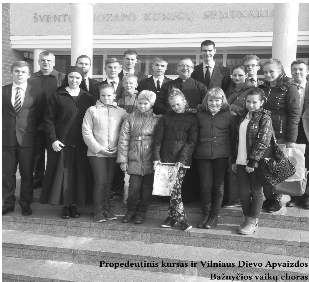
Propedeutinis kursas ir Vilniaus Dievo Apvaizdos Bažnyčios vaikų choras

Kunigas yra tas, kuris padeda visiems artėti prie Dievo. Jis tarnauja Viešpačiui ir žmonėms. Kunigas neša Evangeliją pasauliui ir primena kokią didžiulę dovaną paliko mums Kristus – Eucharistiją.