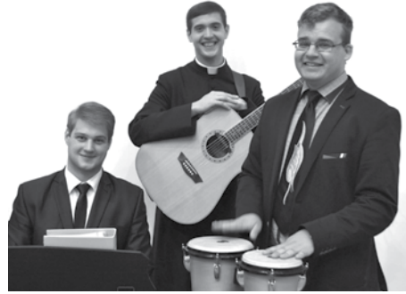
Laisvalaikis su muzika

ar teko girdėti, kad seminaristai mėgsta kūrybą? Širdies gelmėse užgimę jausmai Seminarijoje prasiveržia gitaros, vargonų, paprastos dainos, o taip pat sakralinės giesmės garsais, tad nenustebkite, jei kada nors eidami pro šalį išgirsite pro pravirą Seminarijos langą besiveržiančias Frank'o Sinatros melodijas, bet taip pat nesistebėkite išgirdę švelniai pusbalsiu traukiamą „ Sanctus, Sanctus, Sanctus “, nes būtent tokia yra seminaristo širdis – plati ir talpi.