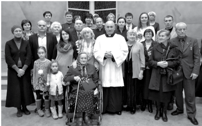
Iviktuvės 2015 12 07

Šiais metais turėčiau užbaigti Šv. Juozapo kunigų seminarijos studijas ir pasirošti priimti šventimus. Mėgstu sportuoti: žaisti tinklinį ir stalo tenisą, važinėti dviračiu; keliauti, būti miške, prie vandens, grybauti, skaityti apie šventųjų gyvenimą. Mano globėjai – šv. Antanas Paduvietis ir Arso klebonas šv. Jonas Marija Vianėjus. Esu dėkingas Dievui už tikėjimo, o taip pat už pašaukimo į kunigystę dovanas. Tai neįkainojami turta. Kviečiu jus visus atverti savo širdies duris Viešpačiui, kad Jis įeity ir apsigyventų amžiams. Linkiu jums drąsos. Nebijokime sekti Kristumi ten, kur Jis kviečia, skubėkime ištart: „Teesie Tavo valia“...