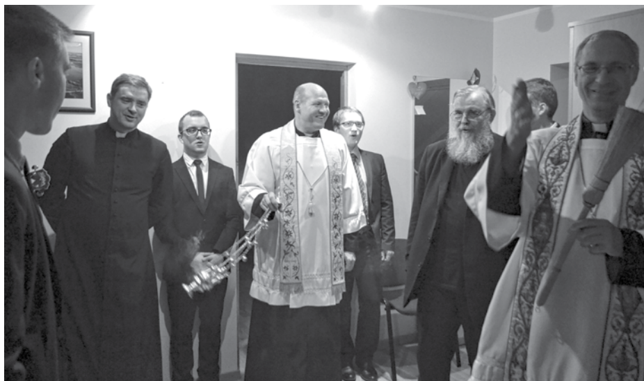
Kambarių laiminimo šventė

Seminarium – lotynų kilmės žodis, reiškiantis daigyną arba atžalyną. Seminarija – vieta, kurioje jaunuoliai, jaučiantys pašaukimą kunigo tarnystei, yra visapusiškai formuojami, kad subres-tų ir gerai pasiruoštų. Pasiruošimas yra ketveriopo pobūdžio.