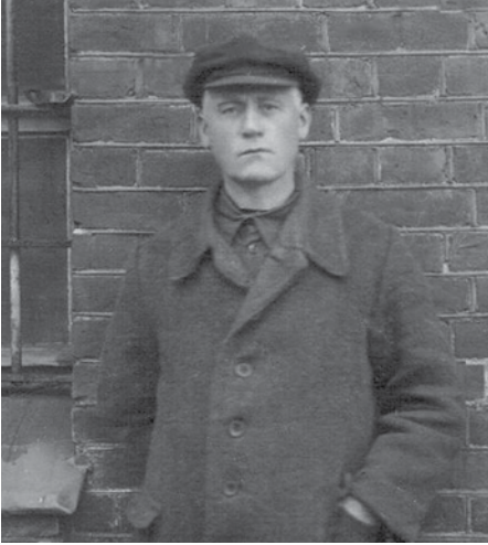
Maskvos kalėjime 1923