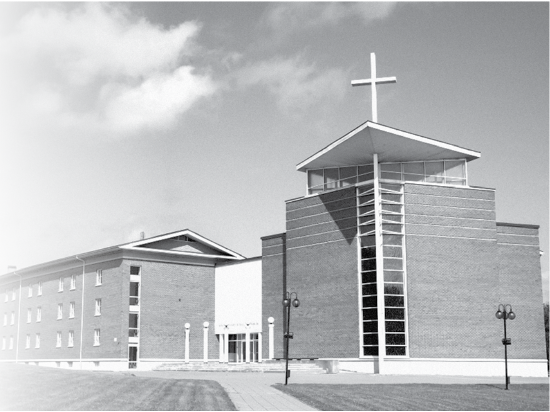
Vilniaus šv. Juozapo kunigų seminarija

pašaukti suvokti ir įgyvendinti didį kiekvieno žmogaus gyvenimo pašaukimą – būti šventu, o tai reiškia gyventi vienybėje ne tik su Dievu, bet ir su savo artimu.