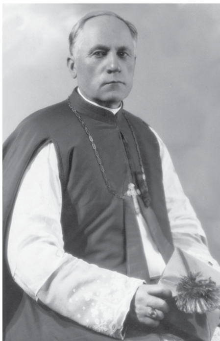
Teofilus Matulionis 1935 m.

Kiekvieno žmogaus kelias yra taip pat kelias ir į šventumą. Netgi tuomet, kai žmogus pameta gyvenimo kryptį, Dievas eina jo ieškoti ir pirmas prašnekina. Ne visuomet išgirstama tai, ką Viešpats byloja, todėl skendima dvasinėje tamsoje.